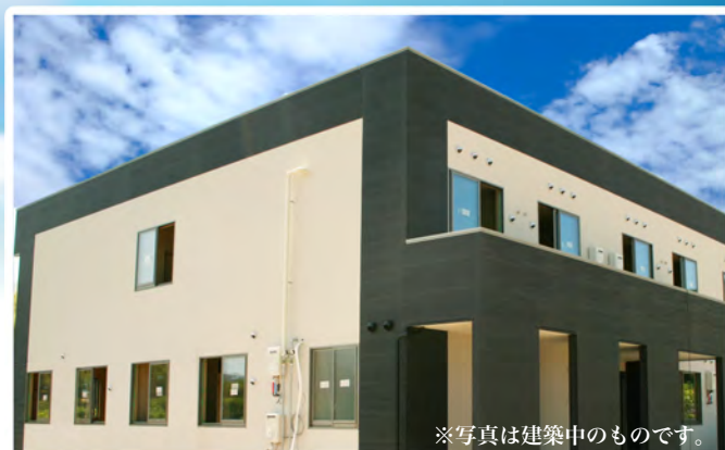
※写真は建築中のものです。